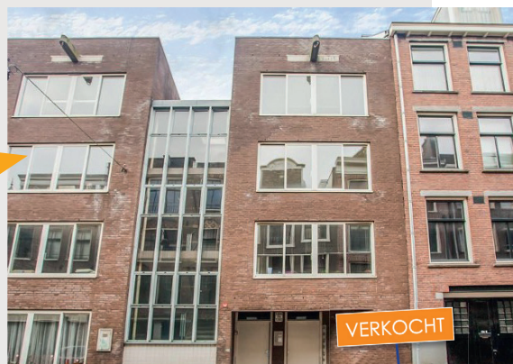
De kopers van de bovenwoning in Arnhem lieten dit koop-appartement van 52 m 2 groot en een vraagprijs van € 265.000 achter.