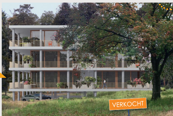
Dit nieuwbouwapartement van 82 m 2 groot en een verkoopprijs van € 395.000 v.o.n. is gekocht door een dame uit Arnhem. Zij laat een twee- onder- een -kapwoning in dezelfde plaats achter.

transacties plaats. Al deze huishoudens kunnen een stap maken naar een passende woning doordat aan de top van de markt een ruime gezinswoning vrijkomt. De omvang van het effect is afhankelijk van hoeveel Empty Nesters verleid kunnen worden naar een kwalitatieve nieuwbouwwoning.