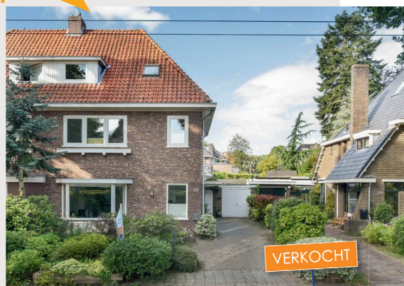
De ruime twee- onder- een -kapwoning is gekocht door een stel met kinderen, die nu eindelijk een stap in hun woon-carrière kunnen maken. Deze twee- onder- een -kapwoning is 174 m 2 groot en heeft een vraagprijs van € 575.000 k.k. Het gezin laat een bovenwoning in Arnhem achter.