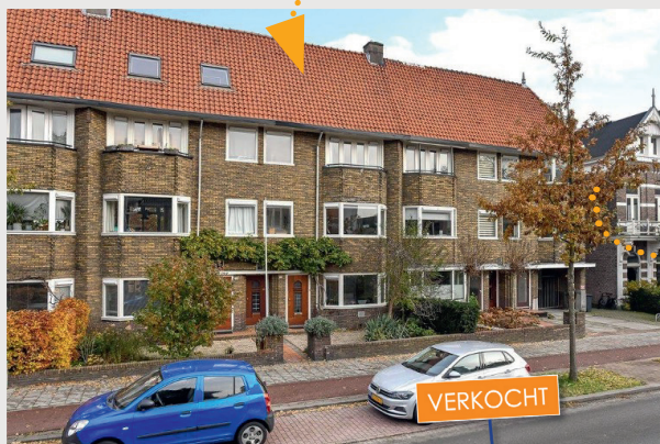
De bovenwoning die ze achterlieten in Arnhem is 136 m 2 groot en heeft een vraagprijs van € 339.000 k.k. De kopers komen uit de randstad en laten een koopappartement in Amsterdam achter.