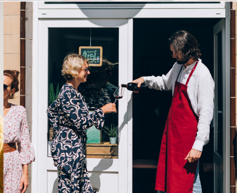
sociale interactie Sociale netwerken