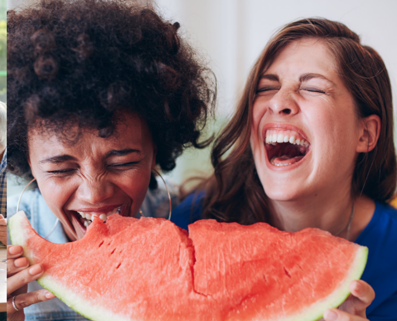
sociale interactie Ontmoeting