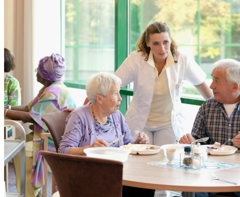
veiligheid Sociale controle