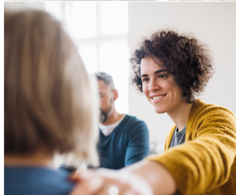
veiligheid Wederzijds vertrouwen